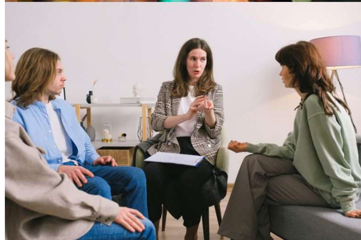
Für pädagogische Arbeitsfelder besonders geeignet ONLINE Mediatorin werden